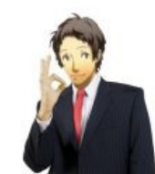
Адати говорит: «маладца!»