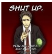
ЗАТКНИСЬ СУКА Advice Adachi