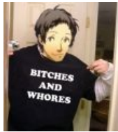
Bitches Don't Know