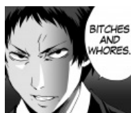
В формате PNG