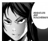
Версия для тян