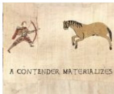
A Challenger Appears