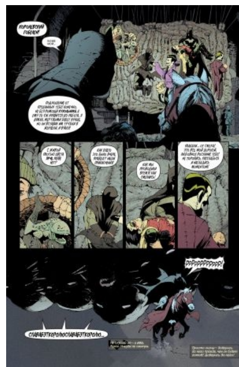
Джокер идею оценил.

Как они дошли до жизни такой? Всё дело в том, что Британские острова не резиновые , а понаехать к ним и как следует прижать местных раньше любили не меньше, чем нынче. Древнее кельтское население Британских островов было в начале нашей эры завоёвано римской армией. Легионеры говорили на своей родной латыни , ставшей письменным языком острова. После ухода римлян в V веке в западные регионы хлынули ирландцы, и письменных языков стало два . Между тем, на восток и юго-восток к уже имеющимся дружинам батавов, франков, саксов и тунгров из Нидерландов, северной Франции и Германии начали переселяться новые, а также англ, фризы и полумифические юты из нынешней Дании. За ними потянулись и шведы. В VII веке положение устаканилось — коренное население вытеснили на западные окраины, и их языки можно услышать разве что в Уэльсе и Корнуолле, а понаехавшие, в основном англ и саксы, основали собственные королевства в центральных и восточных регионах — и с тех пор практически не меняется . Последующие вторжения викингов-данов (предки