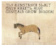
Your resistance only makes my penis harder