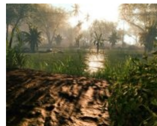
Скриншот из мода Crysis BASKA [2] .