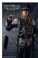
Чем не Властелин?