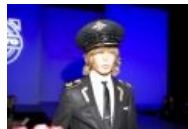
Источник вдохновения №1