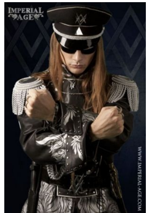
Это Аор. Прямо-таки Чёрный Властелин метала

Дабы сколотить капитал для продвижения своего детища — группы