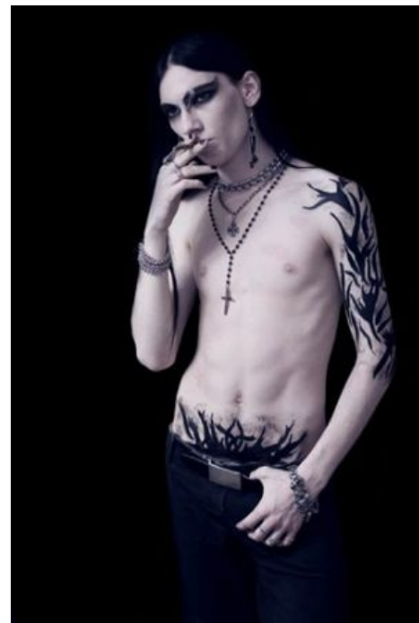
Похож на спортсмена?

«Участники IMPERIAL AGE верят в то, что музыканты должны зарабатывать на жизнь музыкой.