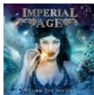
Обложка диска — фапабельна, но не более того