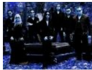
Аор и закипаленные им те говнари