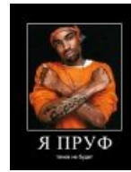
Источник вдохновения №2