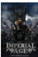
Впечатление, будто у него геморрой