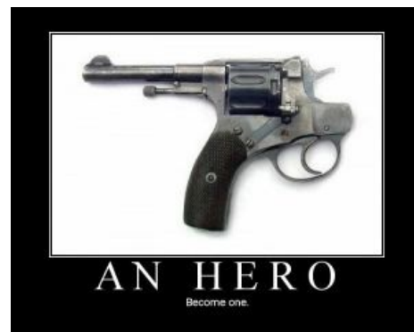
Помощь в решении любых вопросов!