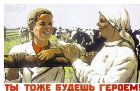
Мотиватор отечественных героев мотивирует!