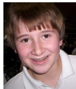
An Hero never forget.

«Самоубийцы делают благое дело — они избавляют мир от самих себя »