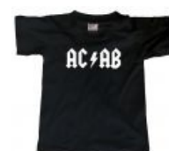
Для любителей AC/DC