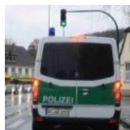
Суровые немецкие полицаи всё знают