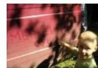
Расовый немецкий поезд