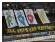
Телепузики как бы намекают...