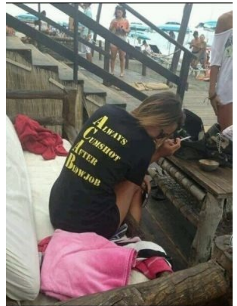
Можно расшифровать и так