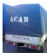
Российские перевозчики тоже в курсе