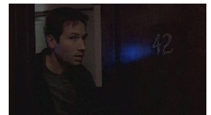
Малдер кагбэ отрицает свою причастность к 42

В сериале и в книгах X-files 42 встречается довольно часто. Так, в эпизоде 6x05 (Dreamland 2 — Страна грёз 2) можно невозбранно удостовериться, что федеральный агент Малдер проживает в квартире № 42, это также описано в рассказе «Эпицентр». Работает он в кабинете № 42, что описано в файле 302 (Операция «Скрепка») книжной, и в эпизоде 3x01 (The Blessing Way — Благословенный путь) телевизионной версий событий. Несколько раз в гостиницах он оказывается также в номере 42. Также в эпизоде 7x19 (Hollywood A.D. — Голливуд, наша эра) Малдер говорит, что смотрел фильм « План 9 из открытого космоса » 42 раза.