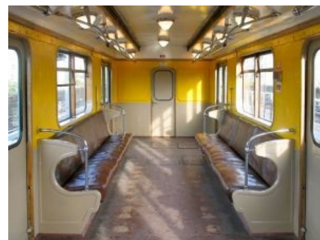
Линкруст — это вам не пластик!

В 1968-м и в 1971-м годах 3605 прославился тем, что на нём (и ещё нескольких консервах с похожими номерами) испытывались новые тележки: сначала — так и не пошедшие в серию для вагонов Ем, потом — опытные усиленные, дальнейшая перспектива которых не