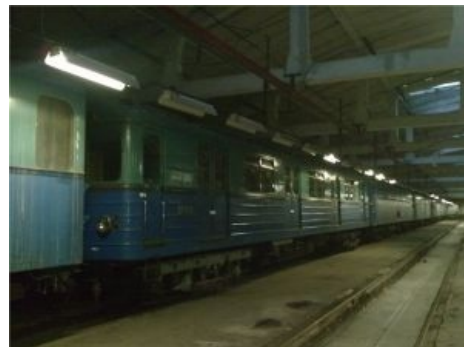
3605 на приколе в депо «Новогиреево», окружённый другим статусным барахлом .