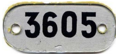
Номерок, висевший в торце салона