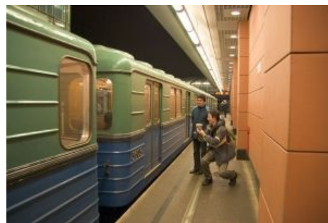
3605 на станции «Кунцевская» (АПЛ) и метростанции.

Году в 2005—2006 несколько студентов РХТУ зачем-то увлеклись историей Московского метро и узнали, что есть на свете вагон 3605. И однажды они вдруг поняли, что в числе 3605 сокрыта великая каббалистическая истина, что этим цифрам надо молиться и свято верить в