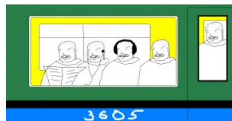
3605 нах ёпта!