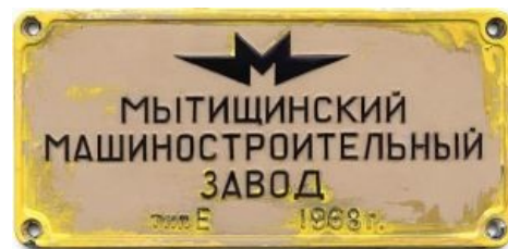
Она самая. Эхехехех...

Однако, после церемонии прощания... 3605 остался и ходил по линии в разных составах в качестве резервного вагона, то появляясь, то опять исчезая. Ближе к концу осени 2007 года он работал на линии практически каждый день (один раз даже съездив до «Международной»). Так и прошёл бывший праздничный день 12 декабря, который неожиданно оказался для вагона последним. Он перестал появляться на линии, а вскоре его обнаружили в депо «Калужское», в целостности и сохранности. Согласно общепринятой точке зрения, ангелом-хранителем 3605 стал музей метро, который выступил за его передачу в обещаемый ещё со времён первого срока Путин несуществующий музей подвижного состава.