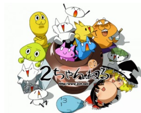
Скриншот сайта 2ch.net

Причину популярности Второго канала у японцев понять нетрудно: работодатели страны восходящего солнца контролируют частную жизнь своих подчинённых похлеще твоего Большого Брата , а сотрудники компаний прочёсывают интернет в поисках компрометирующей сослуживцев инфы, поэтому надёжным способом поведать о своих странных увлечениях и не поплатиться за это карьерой была и остаётся анонимность. В Японии не сложилось своей единой субкультуры вокруг анонимных сайтов подобно американским Anonymous , сплотившимся вокруг Форчана , посему контингент узкоглазых борд состоит из вполне обычного люда: анимешников, домохозяек, офисного планктона — словом, мало отличается от завсегдатаев нашей жэжэжэшечки или вконтаткика. У них нет рейдов , нет единой символики, какого-то вектора общих интересов, и единственное, что их объединяет — это анонимное общение на одних и тех же сайтах.