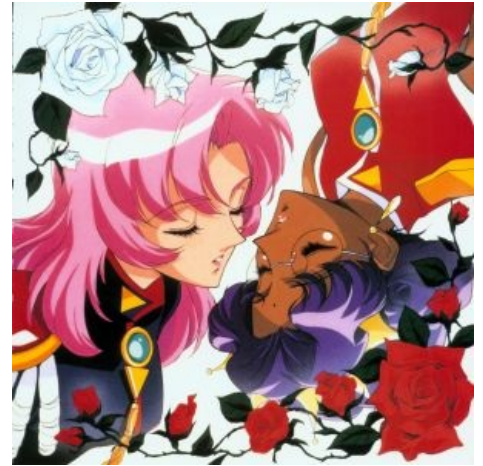
Юная бунтарка и её гян

«Людам не интересны глубокое и сложное изображение лесбийских отношений, им нужны только фансервис и романтика на уровне тонких намёков, так-как люди заинтересованы в лесбийских отношениях, но не в самих лесбиянках »