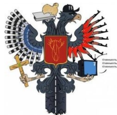
Герб этой страны