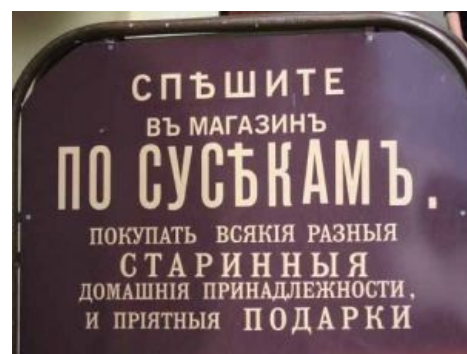
Почти каноничный вариантъ («подарки» только «пріятные», потому какъ мужескаго роду).

Ерь употребляется внутри слова передъ йотированными гласными послѣ приставокъ и основъ сложныхъ словъ, оканчивающихся на согласныя: подъемникъ двухъяруснаго конвейера, адъютантъ Фельдъегерскаго корпуса . Собственно, это единственное употребленіе ера, которое сохранилось и въ пореформенной орфографіи. [1] Ставится ерь также и въ серединѣ составныхъ словъ: контръ-адмиралъ, лейбъ-гвардіи полка подпоручикъ Ржевскій, Санктъ-Петербургскій генералъ-губернаторъ etc. Ерь не