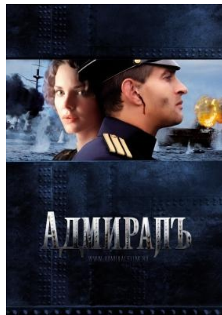
АДМИРАПЪ такой АДМИРАПЪ

Алсо, ерь голямъ — вполнѣ обычная буква, произносится какъ ъ в словѣ «България».