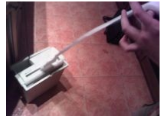
Кормление домашнего офисного любимца туалетной бумагой