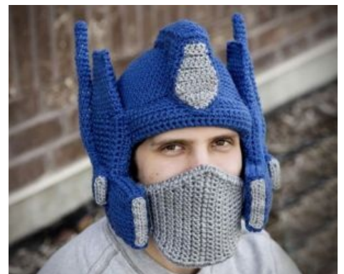
А вы можете звать меня Шредер!