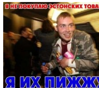
...и его понятия