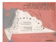
От Нила до Евфрата