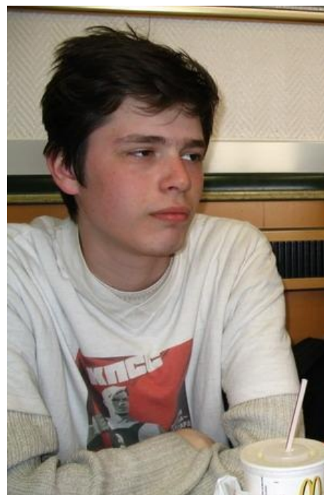
Шляхтич в киевском «Макдональдсе»