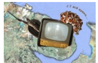
Вот как это выглядит

Родился на улице Герцена. В гастрономе № 22. Известный экономист. По призванию своему библиотекарь. В народе — колхозник. В магазине — продавец. В экономике, так сказать, необходим. Это, так сказать, система... эээ... в составе 120 единиц. Фотографируйте Мурманский полуостров — и получаете te-le-fun-ken . И бухгалтер работает по другой линии. По линии «Библиотека». Потому что не воздух будет, а академик будет! Ну вот можно сфотографировать Мурманский полуостров. Можно стать воздушным асом. Можно стать воздушной планетой. И будешь уверен, что эту планету примут по учебнику. Значит, на пользу физики пойдет одна планета. Величина — оторванная в область дипломатии — дает свои колебания на всю дипломатию. А Илья Муромец дает колебания только на семью на свою. Спичка в библиотеке работает. В кинохронику ходит и зажигает в кинохронике большой лист. В библиотеке маленький лист разжигает. Агония будет вырабатываться гораздо легче, чем учебник крепкий. А крепкий учебник будет весомей, чем гастроном на улице