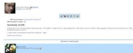
Типичный шабесгой в комментариях у Носика.

Ныне мем употребляется в следующем значении: прислужник ЕРЖ , нееврей, который чересчур активно (с точки зрения называющего) защищает евреев от антисемитских нападок. Синоним «поджидок». Также термин используется поцтреотами для травли либерастов нееврейской национальности и предателей (конкурентов?) из своей среды, а также вообще всех, кто по каким-то причинам в данный момент не нравится поцреоту.