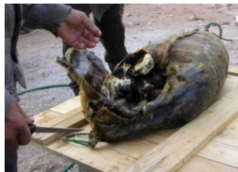
Нежный ароматный копальхен

«Однажды чукча вернулся из Москвы и рассказывает: «Однако, Москву видел, лозунг „Все во имя человека, все для блага человека“ видел, и человека этого видел.» »