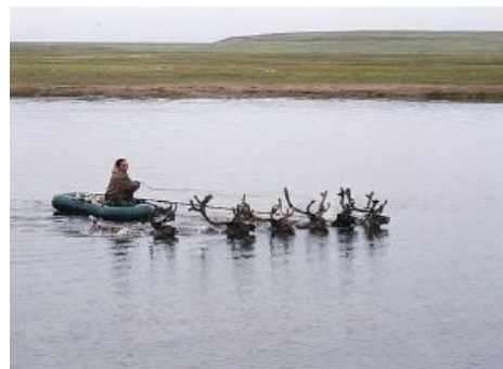
Полный вперёд, однако!

Исследователи отмечают, что появление анекдотов про чукчей пришлось на 1960—1970-е годы. Они вытеснили устаревшие к тому времени анекдоты про пошехонцев, которые были анекдотическими предшественниками чукчей [1] . Появление «чукотских» анекдотов произошло стихийно, «снизу», и связано было, по-видимому, с советскими сообщениями об успехах коллективизации и насаждения цивилизации среди народов Крайнего Севера, а может, после фильма «Начальник Чукотки». Для анекдотов характерен образ «ныне дикого», не просвещённого благами цивилизации и наивного жителя тундры. Однако, есть мнение, что анекдоты про чукчей, как и любые анекдоты про унтерменшей совка, насаждались западом и диссидентами в целях дестабилизации пацифистских и интернациональных отношений внутри империи, что и явилось (как следствие) одной из побочных причин развала совка. Я-тян, пруфов не будет.