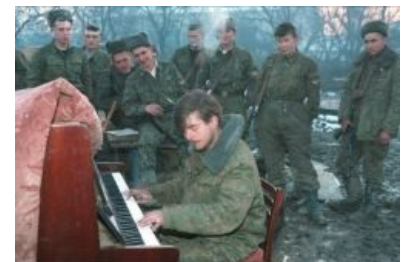
1995 год, Грозный. Эх, пацаны...

«Как бой в городе вести, не знают. "БМП-3" идёт, горит. Экипаж не выходит. Танкист подъезжает, закрывает своей бронёй, говорит: "Мужики, съёбывайте, вы же подбиты! Ещё не горите!". Они не вылезли, блядь. Танку, блядь, снаряд залетел под погон. Ушёл. БМП сгорела вместе с экипажем. Что, кто обучал? Вообще охуеть! »