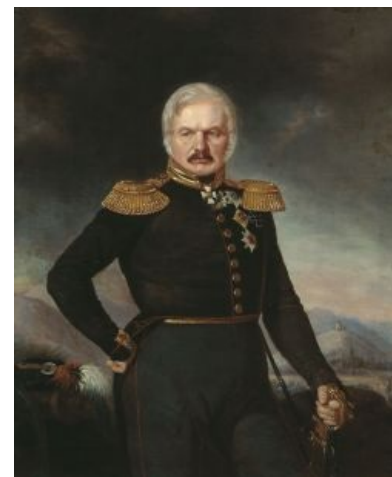
Основоположник конструктивной деятельности на Кавказе. Портрет, внезапно, написан чистокровным нохчой