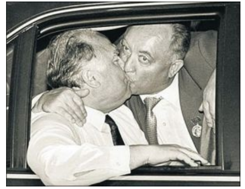
Две жабы целуются [3] .