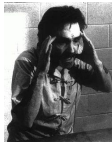
I did it for Lulz!