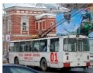
Just as planned!!11