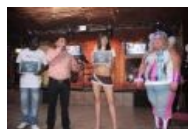
Кого мы потеряли