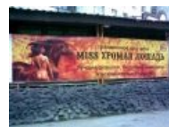
Лошадь Вальехо на фоне огня символизирует