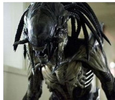
Та самая НЕХ, после скрещивания с Чужим.

Не были обойдены вниманием и представители младшего поколения любителей подобного чтива. Существовала целая серия детских книжек, представлявших собой лютейший трэш, угар и содомию, а именно — кроссоверы боготворимых тогдашней школотой «Черепашек-ниндзя» с популярными на тот момент фильмами. В серии засветился и Хищник — в книжечке «Черепашки-ниндзя и космический охотник», сюжет которой явно был написан по мотивам первого фильма. В книге Хищник (пардон, Охотник) предстает трусоватым упырем-садивом, поклоняющимся некоему божеству. В целом, книга — лютый пиздец, но детишки хавали. Ознакомиться можно тут . Тут отдельно собраны иллюстрации из книги (осторожно, возможно кровотечение из глаз). В этой же серии вышла еще одна книга о Хищнике («Черепашки-ниндзя и Космический агрессор»), являющаяся абсолютно наркоманской сборной солянкой из второсортной фантастики и третьесортных легенд о самураях с нашим героем в роли главного пугала. Иллюстрации еще ужаснее, чем в первой книге. Отдельно стоит отметить вышедший во второй половине девяностых комикс безвестного издательства, пересказывающий первую часть первого фильма. Отличался слегка упоротой (по тем временам) рисовкой и солидной (опять по тем же временам) толщиной.