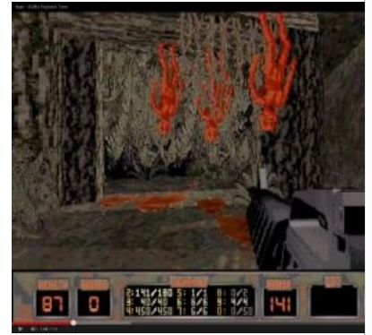
«Джим Хоппер... Я знал его»