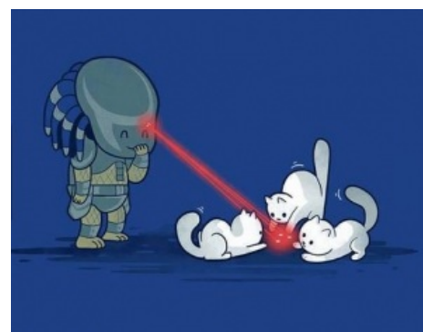
Хищник может в доброту

Сабж — раса высокоразвитых инопланетных ящериков , суть и смысл жизненного уклада которых — Охота. Охота заменяет им развлекуху, фаллометрию, средство разрешения споров и много чего еще, а добыча редкого трофея (обычно в виде черепа) дает владельцу +15 см к длине члена. Ведя первобытный уклад жизни, тем не менее, Хищники достаточно круты, ибо у них есть: