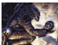
Быть или не быть?