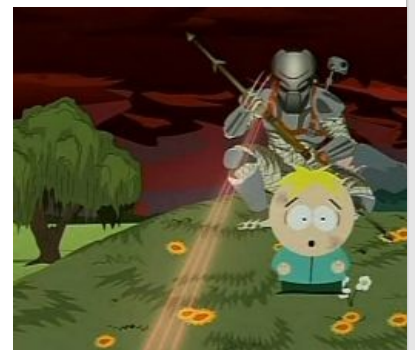
Беги, Баттерс, беги