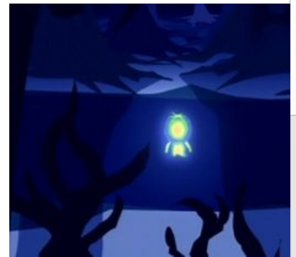
Баттерс, хочешь конфетку?