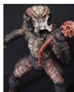
Вырви позвоночник, блять!