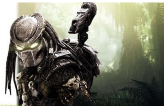
Смотрит на тебя как на будущий трофей