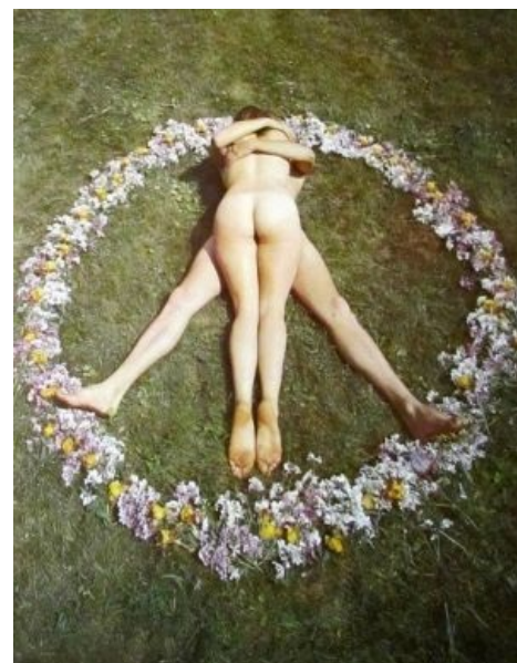
MAKE LOVE, NOT WAR

Предсказателей . Объебосный планктон только и мечтает о такой работе. Именно он доказал на себе, что ЛСД безвреден для организма, и, в подтверждение этому, умер в почтенном возрасте 102 лет здоровым стариком, хотя, на самом деле , лошадиными дозами ЛСД он не жрал. Also, всякие Тимоти Лири: психолог, изучавший ЛСД и впоследствии сильно помешавшийся на нём. Именно он и такие парни, как Кен Кизи с «Весёлыми Проказниками», массово распространили ЛСД25 по Пиндостану. Они же приложили руку к