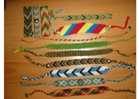
Фенечки — неперемный атрибут всякого уважающего себя хиппана

Изрядная часть хиппи — юные девочки, при этом некоторые весьма ебанутые ебательные — если отмыть их как следует и почистить зубы, ибо за собой они следят крайне... неформально. Однако же в неформальной среде красивая девушка скорее исключение, чем правило. Фрилавщицы обычно страшны как видения после мухоморов, а на соответствующее количество водки у хиппи обычно не хватает денег.