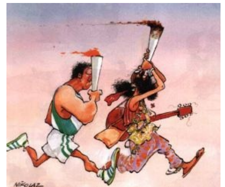
Хиппи на открытии специальной олимпиады