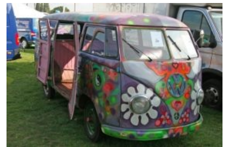
Хиппиваген вмещает в себя много хиппи