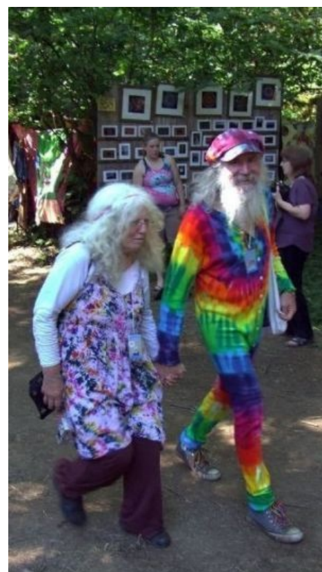
Полный спектр радуги на фестивале

Место обитания стационарного гуру — как правило ашрам (а из трубы торчит лингам ). Пионеры и прочие поциенты могут вписаться в ашрам для повышения духовности за хавчик и флюордрос гуру. Юные хипушки приветствуются особо. Основная идея, продвигаемая разными гуру — «Если тебе не дала одна тьян , не парься, а попробуй с другой». Мысль, надо признать, здравая и на почитателей действует замечательно.