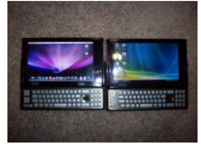
Самый маленький Хакинтош. Слева

Для нормальной работы Хакинтоша вместо некоторых кекстов можно использовать DSDT — эдакий файл-таблицу, из которого macOS черпает данные о твоём железе. Этот файл очень геморрно изготовить не зная ACPI спецификации. Также, когда-то давно набирал обороты загрузчик Clover , который умеет искаропки патчить DSDT пока ты попиваешь Ягу. Однако, чтобы корректно сконфигурировать Clover, необходимо обладать познаниями в области системного программирования , ибо для далеких от Хакинтоша людей, документация загрузчика мутная как вода в колодце родного колхоза, а с кодами ошибок в логах разбирается только некий уебан под ником Slice, который этот самый Clover и сделал. Такие дела. Никакого How-to нет и не будет ввиду претензии на илитарность публики, использующей голый Клевер без богомерзких MultiBeast'ов (которые, тем не менее, и правда превращают систему в свалку с говном). На русскоязычных форумах вас, скорее всего, пошлют на йух при попытке высказать мнение, противоречащее коммерческой выгоде местных онемэшных долбаебов. С конца 2019 года,