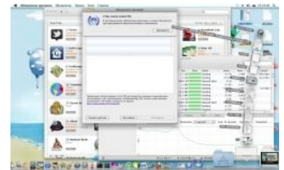
Таки да, Software Update тоже