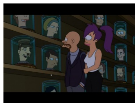
Он самый (в правом верхнем углу)