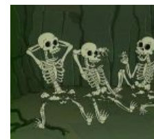
И смерть через сну-сну