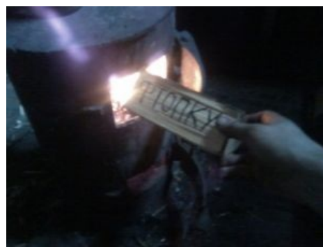
И вот так можно!