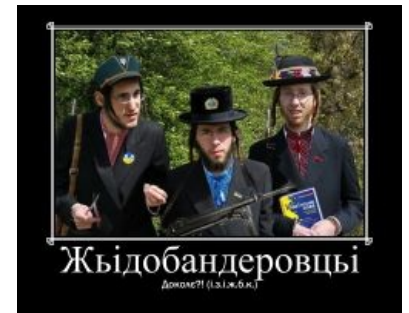
Жыдобандеровцы сферическіе у вакууме. ІЗІЖБК