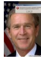
Фотошоп открывает истину