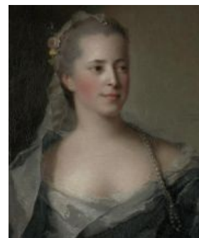
Фотошопер сосёт у Жан-Марка Натье : на портрете 37-летняя женщина

Смотри, анон: реальная женская жопа выглядит так