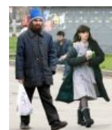
Это тоже фотошоп