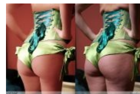
Смотри, анон: реальная женская жопа выглядит так