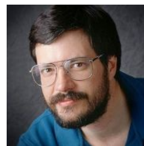
Томас Нолл. Хочет отфотопшопить тебя

В версии 5.0 были введены возможности управления цветом и панель истории (History Palette), с помощью которой можно откатывать все кракозябры. Значительные изменения произошли вместе с выходом версии 5.5 — в комплекте с Photoshop поставлялась ещё одна нахуй никому не упавшая программа — ImageReady, которая добавила к функционалу ещё и богатые средства разработки графики для WEB. В то время дизайнеры (за исключением некоторых нищобродов) пользовались более продвинутым софтом. В следующей версии — 6.0 появились стили слоя (Layer Styles) и расширенные возможности управления текстом. Восстанавливающая кисть (Healing Brush), которой гламурное кисо любит «лечить» своё еблище, появилась в версии 7.0.