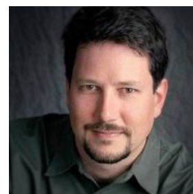
Джон Нолл. Смотрит на тебя свирепо, как на говно-фотоньку