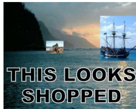
This looks shopped painted