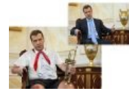
Медведев — пионер