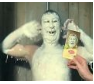
Фотожаба из эпичнейшей серии «Алёнка»