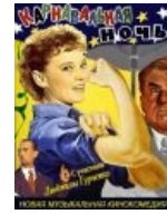
We can do it!