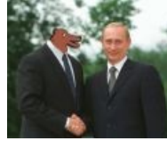
Медвед и Путин