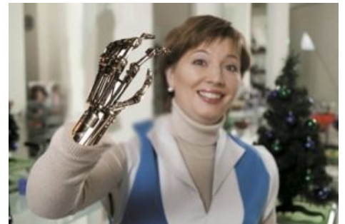
Сферическая фотожаба в вакууме

Самым первым фотомонтажом считается работа британского фотографа Генри Пича Робинсона , которая называется «Fading Away» и была создана в 1858. На фотографии изображена сцена смерти больной туберкулёзом молодой девушки. Для создания работы Генри Пич совместил между собой пять различных негативов. И да, мой юный друг, в 1858 году никаких фотошопов ещё не было.