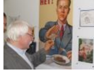
Плакат «Нет!» IRL