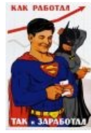
Советские плакаты — излюбленная тема фотожаб