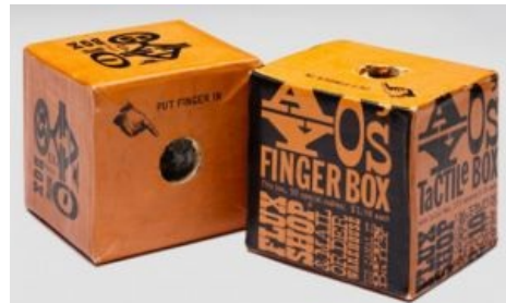
Знаменитый (возможно, изначальный) AY-O's fingerbox.