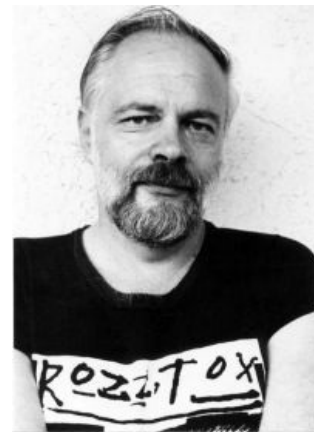
Смотрит на тебя, как на амфетамин

писать фантастику (исключая роман «ВАЛИС», в котором пытался передать своё мировоззрение), строчил богословские трактаты и познавал радости жизни хикки , тем самым вернувшись к истокам — поначалу Дик вовсе презирал фантастику и тянулся в Высокую Литературу, высрав аж 12 реалистических романов, но не фартануло. По собственным словам, после одного неудачного визита к стоматологу он вступил в контакт с некой божественной сущностью женского пола , которая объяснила ему всё-всё-всё на свете, в том числе рассказала, что на самом деле он — реинкарнация христианина Фомы из Римской империи , которого задушили гарротой. Такие дела.