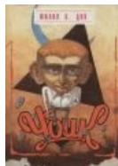
Типичная русская обложка