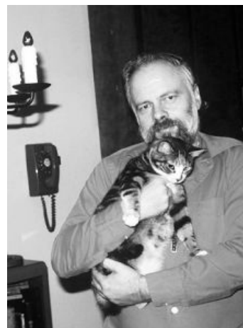
Дик и его сраная кошка