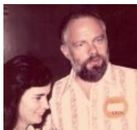
Ещё немного упорного взгляда