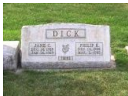
Преодолевший чувство вины Дик