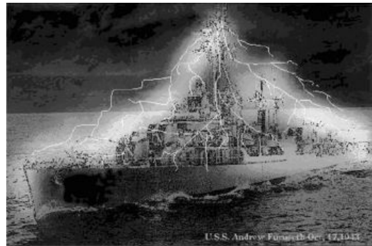
«Элдридж», давай, до свидания!

При помощи эксперимента военные пытались проверить смелое предположение о том, что электромагнитное поле высокой мощности, сгенерированное вокруг материального объекта определенным образом, может привести к визуальному исчезновению этого объекта благодаря эффекту огибания тела световыми и радиоволнами. В случае удачи объект должен был исчезнуть как из поля зрения наблюдателей, так и с экранов радаров. Кроме того, физики собирались проверить Единую теорию поля, сформулированную Эйнштейном (по неподтвержденным данным, сам великий физик был причастен к опыту, но предпочитал оставаться в тени). Эксперимент был проведен в порту Филадельфии 28 октября 1943 года. Объект испытаний — эсминец «Элдридж» с находящейся на борту командой из 181 члена экипажа . На корабле были смонтированы четыре мощных генератора электромагнитных колебаний, которые, по расчетам, должны были создать вокруг корпуса судна невидимый «электромагнитный кокон».