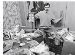
Типичный обыск дома у типичного фарцовщика