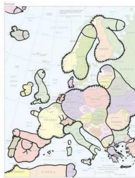
Фаллически редуцированная карта Европы

Anacondaz — Член (Official Music Video) В музыке.