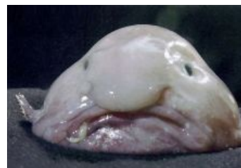
Унылое говно в вакууме [1]