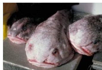
И его семья