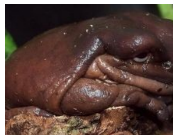
Унылое говно глядит виновато и смущённо, как бы говоря: «Не виноватое я...»