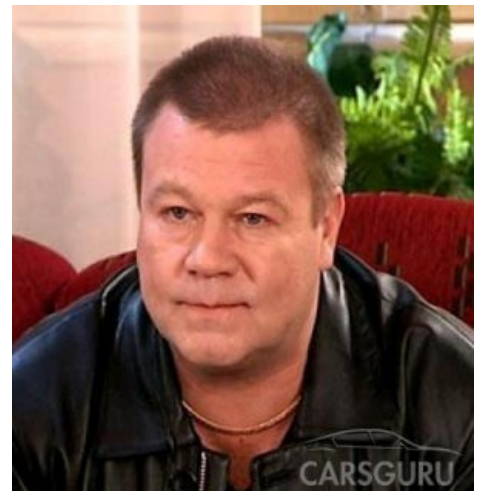
Дукалис а.к.а. Селин, уже измученный Нарзаном

Демонический Танец Дукалиса(Full) Демонический танец Дукалиса