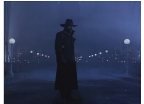
Улучшенная версия Казанцева

Значимость персонажа была неслабой, посему его уход породил множество срачей на тему «Лучше ли с Казановой или заебись без него». Сам актёр утверждал, что причиной его ухода стало то, что сериал стал скатываться в УГ, уподобляясь американским дешёвым сериалам про копов и их пончики, но анонимуса не обманешь — Звёздная Болезнь . Впрочем, это один из немногих актеров сериала, получивших после одного роли в полнометражных фильмах. Чуть позже своего ухода из УРФ засветился в эпизодической роли всё того же опера в «Бандитском Петербурге», а уже сильно позже снялся в сериале «Версия» в роли следователя на том же Ненормальном ТелеВидении .