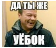
Да ты ж уёбок!