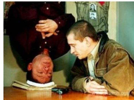
Кадр из Убойной силы

Первая попытка клонировать Ментов случилась в 2000 году. Сериал «Убойная сила», созданный сценаристом тех же «Ментов» — это напомним винрарный Андрей Кивинов. Поначалу был эдаким спин-оффом. Более того, на момент первого сезона «Убойной силы», оба сериала шли в одно и то же время на двух конкурирующих каналах НТВ и ОРТ, с одними и теми же главными героями. В результате начался срач между представителями этих телеканалов. Создателей «Убойной силы» по решению суда заставили отказаться от героев, и вторая часть стала самостоятельным произведением, с другими персонажами, исключение составил только второстепенный персонаж — бомж Померанцев, который окончательно перекочевал в «Убойную силу», а в «УРФ» в дальнейшем уже не появлялся. Но сериал «Убойная сила» закончился в 2005 году, а «Менты» всё ещё продолжают мозолить глаза. Что примечательно, «Убойная сила» была одной из самых первых киношных работ дозорного Хабенского , и, по-видимому, на этой роли он и раскрутился. Алсо, в последнем сезоне «Ментов» новым начальником убойного отдела внезапно стал тесть Васи Рогова из «Убойной силы». Не по сюжету конечно, просто актер оказался тот же.