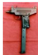
Узи-пистолет с 40патронным магазином