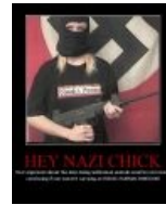
Даже фашисты выбирают UZI!