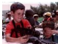
Типичный расовый фанат