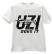
Футболка для фонната