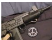
Они любят убивать людей... Во имя мира!