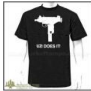
И еще одна...