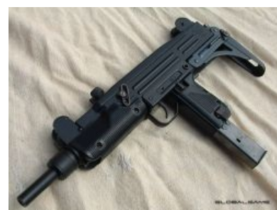
Канонічний вид сабжа

Узи (ивр. תזי , англ. Uzi , школьн. Узиска ) — серия былинных пистолетов-пулеметов производства б-гомерзкой еврейской корпорации Israel Military Industries (IMI), мегапопулярное в масс-медиа и IRL , легально состоящее на вооружении в 95 странах по всему миру, уже более полувека служащее бравому делу покорения планеты еврейскими расовыми жидками. Также УЗИ — исследование организма человека с помощью ультразвуковых волн.