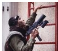
На голубых экранах