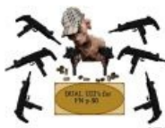
Йумор в жилу