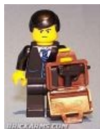
Лего тоже в сговоре