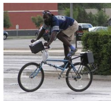
А разве что-то сломано?