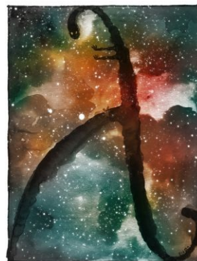
Великий и ужасный Лямбда-член.

Один из самых очевидных вариантов — это просто плотность энергии вакуума такая (согласно квантовой механике , из-за принципа неопределённости Гейзенберга даже в совсем пустом месте постоянно происходят квантовые флуктуации — рождаются и исчезают частицы, и хотя в среднем частиц в вакууме нет, энергия в среднем в вакууме есть). Однако на текущий момент теоретики плотность энергии вакуума вычислять не умеют (получается либо очень много, гораздо больше, чем надо, либо вовсе бесконечности на бесконечностях, и не