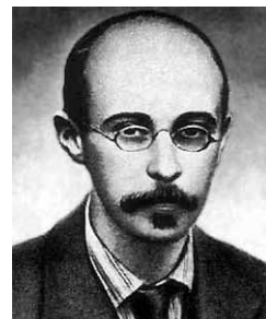
Фридман недоволен бумагомаранием Эйнштейна