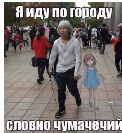
To Aru Majutsu no Index

Если у тебя есть широко мыслящие друзья, при этом не являющиеся придурками, расскажи им о своей тупле. Ты можешь быть переводчиком, и твоя тупла будет наслаждаться общением с кем-то помимо тебя. Учитывай, что нравится твоей тупле, а что нет. Если ей нравится шикарное кино, и она хочет смотреть его в кинотеатре, можешь иногда баловать её. Я не предлагаю прогибаться под каждую её прихоть, но иногда это мило — баловать её чем-то. Не забывай, она не может взаимодействовать с миром никаким способом. Она тоже хочет испытывать что-то и делать разные дела.