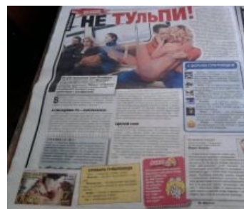
СПИД-Инфо срывает покровы

Впрочем, по данным на момент сентября 2013 сообщество несколько поутихло. Создатель сервопрагматики махнул на этот веселый карнавал рукой и выпилился из зоны видимости, оставшиеся тульпофорсеры окончательно склонились в эзотерическую сторону и занимаются антинаучной хуйней — меняются тульпами (sic!) и пытаются построить атсральную сеть между друг другом. ИЧСХ, говорят, что достигли в тульподоставках успехов. Ждем появления тульпанета и первого в мире роутера на