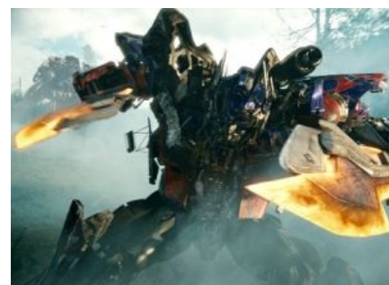
Оптимус крут и пафосен!

Фильм о сабже хотели снять ещё в начале двухтысячных (на самом деле, хотели снять фильм по мотивам G.I. Joe — линейке игрушек-солдатиков, но, когда вспыхнула война в Ираке, поменяли на Трансформеров), однако долгое время идея провисела в воздухе, потому как требовался высочайший уровень спец-эффектов. Поэтому, когда году в 2004-м в Интернете появились первые слухи о том, что студия Paramount Pictures будет снимать фильм о трансформерах, среди фанатов это произвело эффект разорвавшейся бомбы, ведь на тот момент интерес к сабжу в мире неотвратимо угасал. Новые японские сериалы нравились далеко не всем и соответственно не пользовались такой популярностью, как в свое время Generation 1 , комиксы Dreamwave канули в лету, и, казалось, трансформеров ожидает полное забвение. А тут вдруг — фильм! Разумеется, это сразу стало самой обсуждаемой темой на фанатских форумах, а время от времени появляющиеся в Интернете новости и слухи только подливали масла в огонь.