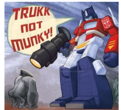
Оптимус недоволен своим потомком.

Третий коллекционерский срач, связанный с одноимённой компанией. Эта самая компания прославилась уёбищным качеством моделей (причём косяки из раза в раз не меняются) при огромной цене ($150 за модель лидер класса против $120 у конкурентов). В то же время, многих персонажей выпустили только они. Некоторые коллекционеры наотрез отказались покупать у говноделов (в руках разваливается), другие, аргументируя, что они покупают модель на полку, а не поиграться, всё таки берут. Каждая тема о новом товаре Иксов сопровождается срачем со срывом покровов и стенаниями несчастных, которые таки рискнули это трансформировать.