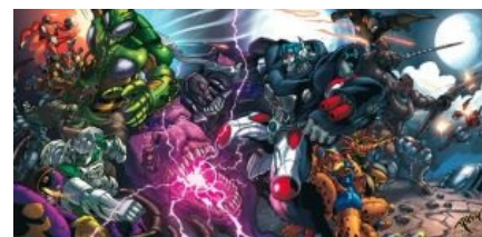
Beast Wars, максималы превозмогают!

На самом деле, ничего кардинально нового в превращении в животных не было: этим могли похвастаться ещё диноботы, инсектоиды, предаконы и террорконы из оригинального мультфильма. Однако, там они всё же