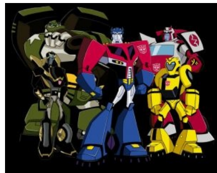
Упрощенная, но оригинальная рисовка нравится далеко не всем