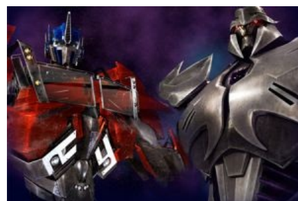
Дизайн персонажей сделан почти как в фильме