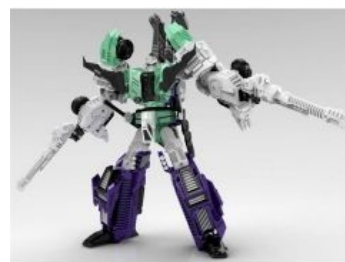
Quakewave - первая и самая редкая модель Fans Toys.