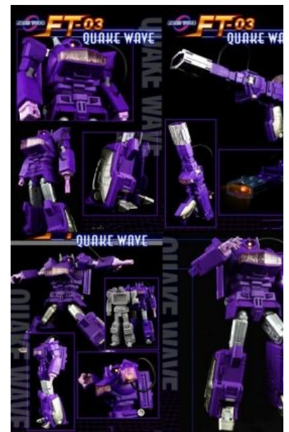
700 долларов! 700 долларов, Карл!