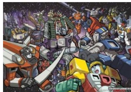
Как то так. Хорошие — справа

Сюжет самостоятельный, однако имеется множество отсылок к ранним частям франшизы. Например, адова субстанция Темный Энергон приехала прямым рейсом из игры «Transformers: War for Cybertron», история происхождения Мегатрона и Оптимуса Прайма - из комиксов War Within (первый — гладиатор-революционер , второй — библиотечный клерк ), равно как и предыстория в целом , вехиконы — из Beast Machines, десептиконский крейсер — прямоком из G1. Но больше всего отсылок к другим поделкам про трансформеров — в дизайне персонажей. Некоторые похожи на персонажей «Transformers: Animated», некоторые — почти подчистую содраны из фильмов Майкла «Больше взрывчатки» Бэя, ну а кому-то повезло щеголять и оригинальной внешностью. Но несмотря на всё это, Prime не обзавёлся собственной вселенной, а происходит во вселенной, начатой игрой War for Cybertron, что порой создаёт некоторые логические парадоксы и