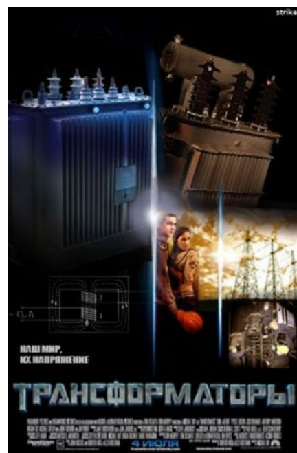
Анонимус любит фильм Майкла Бэя

В следующем году была запилина The Transformers: Mystery of Convoy («Трансформеры: Тайна Оптимуса Прайма», или Конвоя, так как японским детишкам сложно выговорить «Оптимус Прайм»). Суть: бежать ВПРАВО,