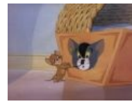
Серия 1943 года. Nuff said.