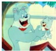
Спайк и Тайк