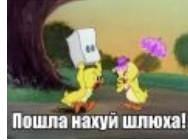
Двощ, тяны — не нужны.