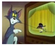
Дядюшка Пекос овладевает Тома.