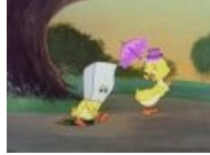
Двоч, есть одна тян.