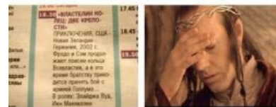
Журнализды покусились на святое.

Троллить неопытных толкиенистов, как в этих ваших интернетах, так и IRL , просто и легко, что делает процесс скучным и неинтересным, как браконьерство в заповеднике. Единственное кошерное применение — это откорм и обучение молодых троллей в тепличных условиях. Следует также не забывать, что заповедник может охранять тяжеловооружённый егерь- модератор . Ярчайший пример всеобъемлющего пиздеца в МНУ толкиенистов — tolkien.su . Темы вроде этой символизируют.