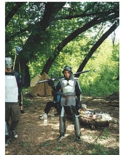
Толчок такой толчок

В частности, ими считалось, что фехтование — это тонкое искусство, в котором не нужно сильно бить противника, а стоит легонько прикоснуться к нему кончиком меча. Люди, которые не сдерживали удар, были не в фаворе и назывались «маньяками».