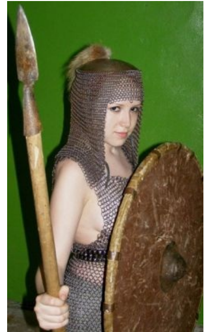
Самка толчка радуется Фрейда