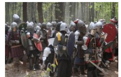
Кавайные ня-мальчики с палками из 90-х подростки и собираются к тебе в гости