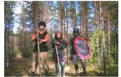
Они как бы говорят: «Мы вас отпиздим!»

В середине лихих 90-х, когда эти ваши интернеты были недоступны большинству толкинутых ввиду