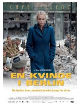
Датский фильм раскрывает суть

«Когда у нас начнётся такое, русские алкаши пальцем о палец не ударят»