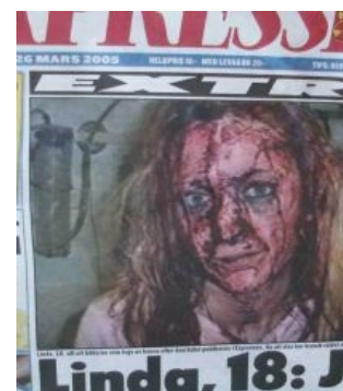
77% изнасилований в Швеции совершает 2% мужчин-мигрантов