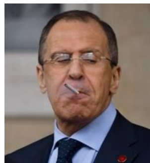
Лавров кончил и закурил