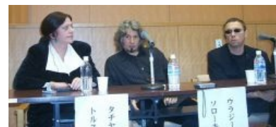
Никитична с Олеги чем и Георги чем. Редкое фото.