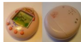
Apollo — наиболее популярный в 90-е китайский Тамагочи

На самом пике популярности этих девайсов среди школьников считалось понтом иметь как можно больше и круче тамагочи; крутость тамагочи оценивалась количеством кнопок: трёхкнопочные считались самыми лоховскими ( ЧСХ , оригинальный японский девайс фирмы «Бандай» был и остаётся именно таким), а девайс с пятью и