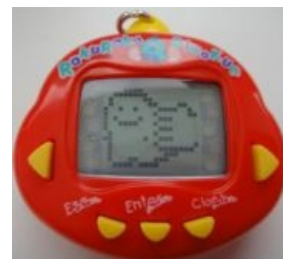
Dinokun — конкурент Apollo.

Apollo — наиболее популярный в 90-е китайский Тамагочи