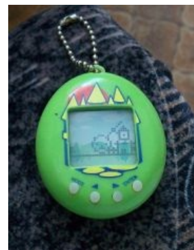
Ещё вариант Apollo