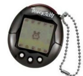
Там-тамагочи с цепи на