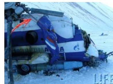
Последствия удачной охоты на Алтае.

земли по мирному вертолету охотников (в обшивке вертолета были найдены пулевые отверстия), вследствие чего мирный вертолет охотников разбился . ИЧСХ, сбив вертолет, бараны не успокоились и решили взять его приступом, но при штурме смертельно раненные депутаты отбили атаку. Интернеты наполнились драмой и выражали искреннюю печаль в связи с гибелью редких животных. Особый цимес ситуации придавало то, что в числе удачно сходявших на охоту оказался видный чиновник по охране природы . Подробности в изложении МАК здесь , на официальном сайте ссылка на документ почему-то отсутствует.