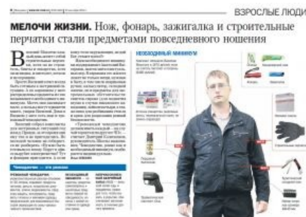
Сферический сурвивалист IRL. Он же — автор тревоги.су